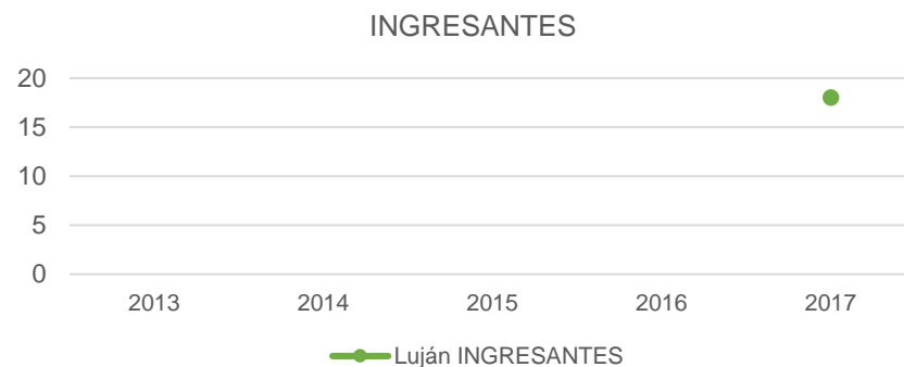
Tabla 2. Ingresantes de la Carrera y tasas de crecimiento

4 De acuerdo a la Resolución HCS 996/15, "se considera ingresante a todo aspirante que haya dado cumplimiento a las siguientes condiciones: