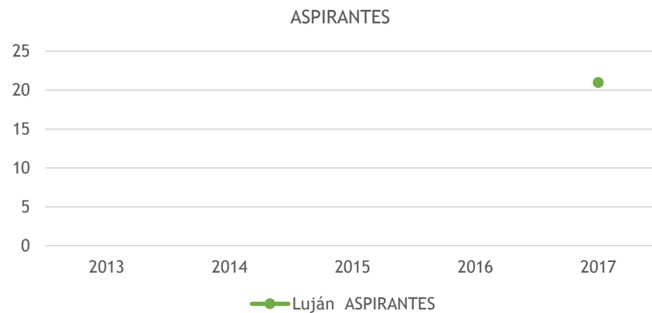
Tabla 1. Aspirantes de la Carrera y tasas de crecimiento