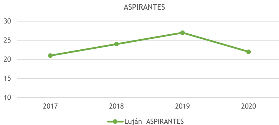
Tabla 1. Aspirantes de la Carrera y tasas de crecimiento