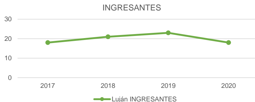
Tabla 2. Ingresantes de la Carrera y tasas de crecimiento

4 De acuerdo a la Resolución HCS 996/15 y sus modificatorias, "se considera ingresante a todo aspirante que haya dado cumplimiento a las siguientes condiciones: